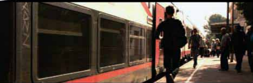
Une série documentaire imaginée et réalisée par Jonathan Trullard

C'est en excursion au bord de mer que la petite équipe de cinéphiles a posé bagages pour mener une enquête sur l'avenir du cinéma. Celle-ci sera faite d'étranges rencontres, jusqu'à une visite inattendue du plus vieux cinéma du monde! Pour connaître la vérité sur l'avenir du septième art, l'investigation les mènera jusqu'à l'actrice et réalisatrice Sandrine Bonnaire.