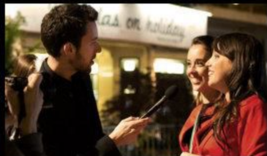
Une série documentaire de Jonathan Trullard