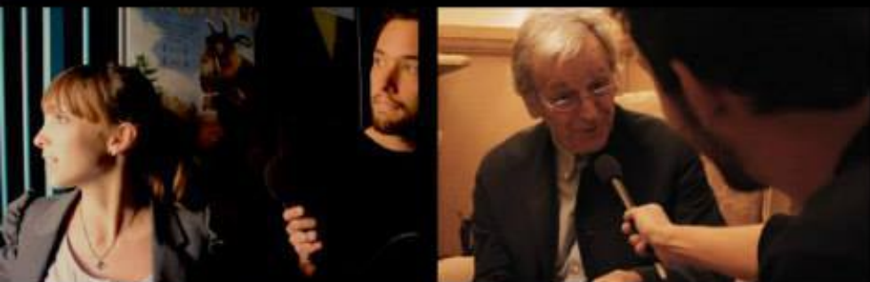
Une série documentaire imaginée et réalisée par Jonathan Trullard

C'est dans le quartier de l'Estaque à Marseille que Jonathan et son équipe reprennent la route pour une nouvelle enquête, menant cette fois une investigation sur le cinéma militant qui les mènera jusqu'au réalisateur Costa-Gavras.