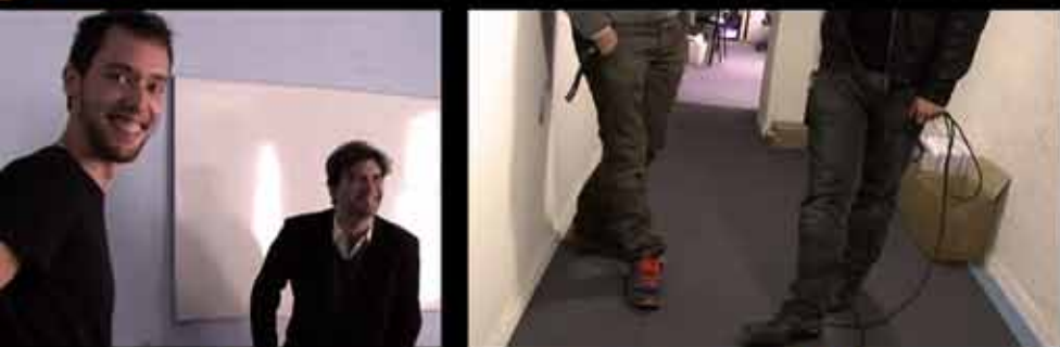
Une série documentaire imaginée et réalisée par Jonathan Trullard

Et si on allait au cinéma lorsque tout va mal ? Jonathan et sa petite équipe partent pour une leur toute première enquête, se demandant ce qui motive les spectateurs à se rendre encore au cinéma en cette période de crise. Il y aurait-il un lien entre la dépression économique ou personnelle et la fréquentation des salles ? D'étranges révélations remplissent leur journée.