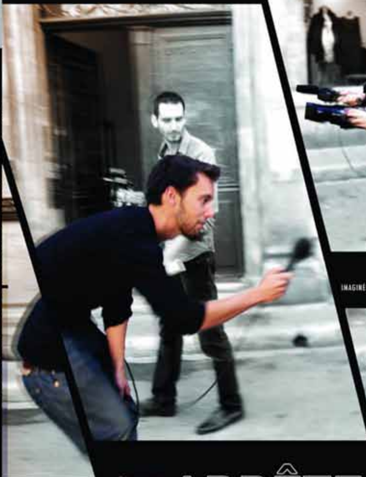
UNE SÉRIE DOCUMENTAIRE IMAGINÉE ET RÉALISÉE PAR JONATHAN TRULLARD

Le centre socio-culturel Jean-Paul Coste présente