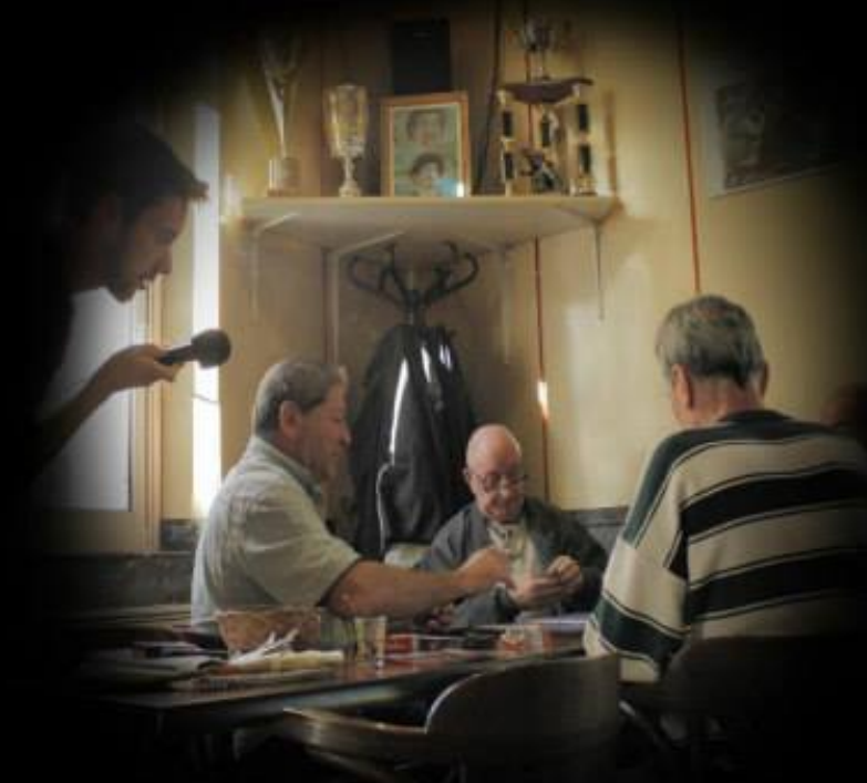
Une série documentaire imaginée et réalisée par Jonathan Trullard

ÇA A VRAIMENT UN SENS LE CINÉMA MILITANT ?