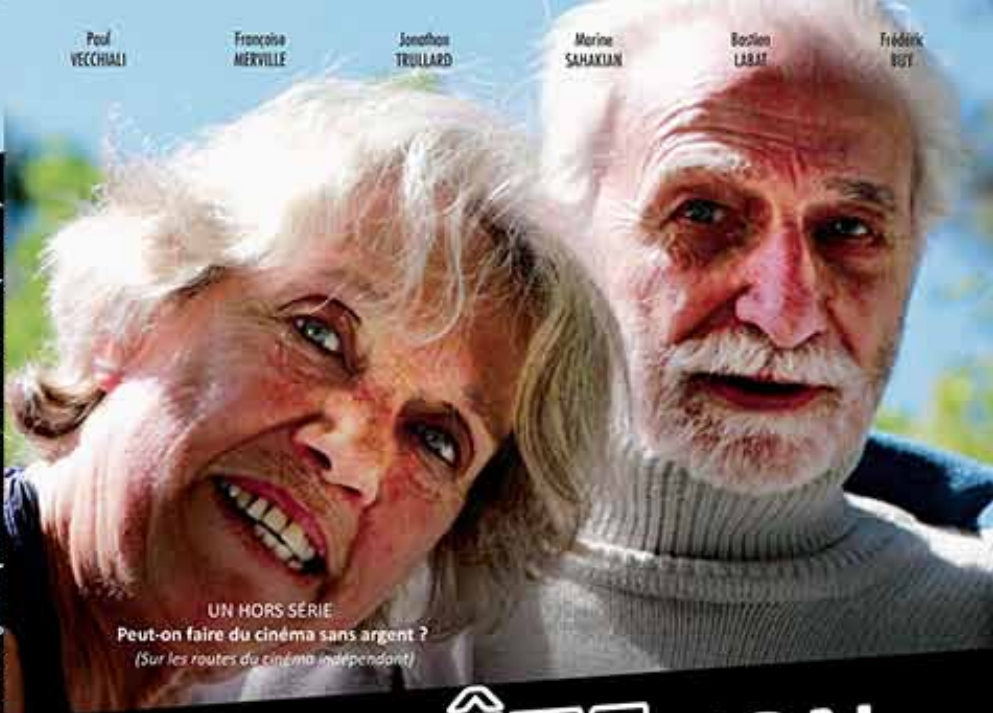
UN HORS-SÉRIE Peut-on faire du cinéma sans argent ? (Sur les routes du cinéma indépendant)