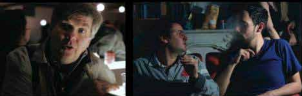
Une série documentaire imaginée et réalisée par Jonathan Trullard

L'équipe de cinéastes en herbe se lance dans une curieuse enquête nocturne sur le film musical. Des surprises couissées d'un spectacle chorégraphique à l'intrigante entrevue avec le compositeur Jean-Michel Bernard, la petite bande ne se doute pas des singulières rencontres qu'ils feront sur leur chemin.