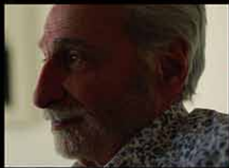
Une série documentaire imaginée et réalisée par Jonathan Trullard