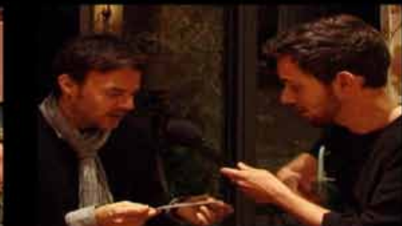
Une série documentaire imaginée et réalisée par Jonathan Trullard