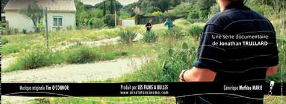
Une série documentaire de Jonathan TRULLARD

Hors-série | Peut-on faire du cinéma sans argent ? (Sur les routes du cinéma indépendant)