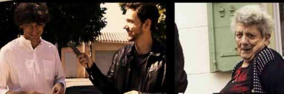
Une série documentaire imaginée et réalisée par Jonathan Trullard

La petite équipe repart sur les routes du cinéma, et se lance cette fois dans une drôle d'enquête sur le court-métrage. Du village de Fuveau aux bureaux du festival Tous Courts en passant par une promenade avec le réalisateur Denis Cartet, les enquêteurs cinéphiles auront d'étonnantes révélations sur ce format de cinéma.