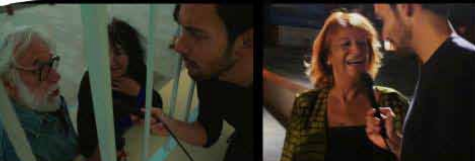
Une série documentaire imaginée et réalisée par Jonathan Trullard

Un an après leur enquête sur l'avenir du cinéma, la petite bande de cinéphiles retrouve le bord de mer et surtout l'Eden. En effet, l'équipe est au rendez-vous pour la réouverture de la plus vieille salle de cinéma du monde. L'occasion de retrouver celles et ceux qui avaient croisé leur route un an auparavant. L'enquête sur l'avenir du 7e art se poursuit donc et de bien surprenantes découvertes les attendent une nouvelle fois.