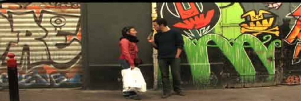
Une série documentaire imaginée et réalisée par Jonathan Trullard

C'est pour la première fois à Marseille que les amis cinéphiles vont tendre le micro pour enquêter sur le véritable état de santé du cinéma français après les récents succès commerciaux. Les rencontres seront variées avec notamment un surprenant vendeur d'affiches de film, un étrange vidéoclub et une rencontre avec Vassili Meimaris sur les toits de la commission du film PACA.